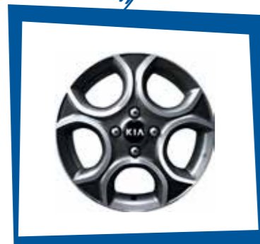
AROS DE ALEACIÓN DE 15"

Que se retraen electrónicamente para un mejor estacionamiento.