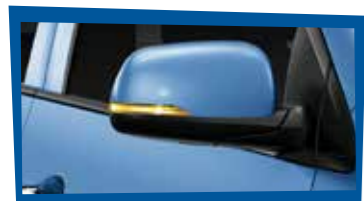
LUCES EN ESPEJOS RETROVISORES Y RETRÁCTILES

Que se retraen electrónicamente para un mejor estacionamiento.