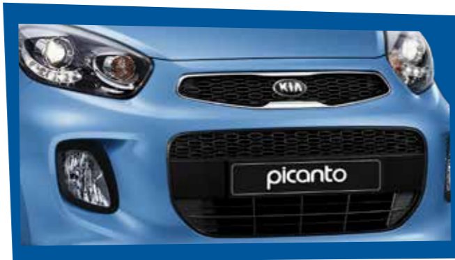
IMPONENTE MÁSCARA "TIGER NOSE" Característica de la marca KIA.