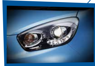
FAROS DELANTEROS DEPORTIVOS